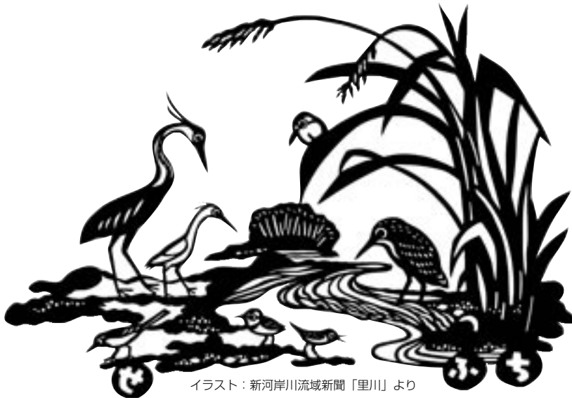
イラスト：新河岸川流域新聞「里川」より

全7回講座 6・16 (日) 6・30 (日) 7・14 (日) 7・28 (日) 8・25 (日) 9・8 (日) 9・22 (日) 各回とも2時間 午後4～6時