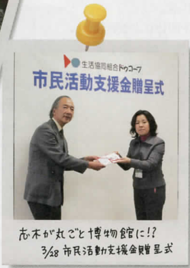
生活協同組合ドゥコープ 市民活動支援金贈呈式