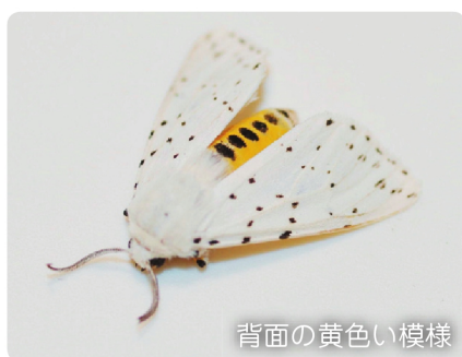
背面の黄色い模様