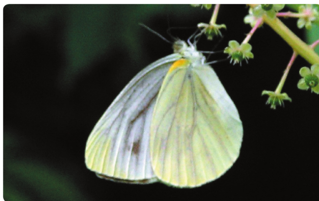
スジグロシロチョウ

シロチョウ科 開張 44 ~ 45mm 食草：キャベツ・ブロッコリー 白い翅に黒い紋が入っている。