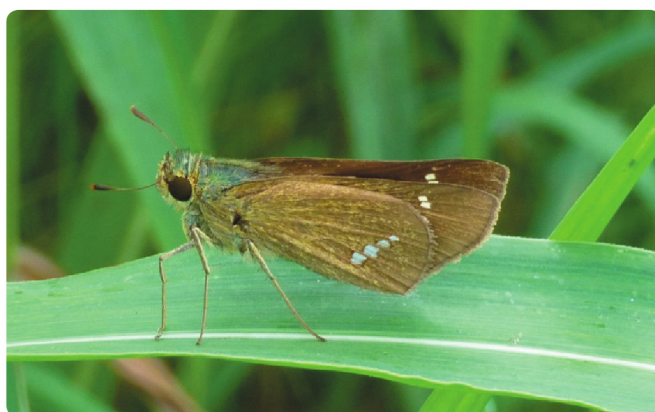
イチモンジセセリ

セセリチョウ科 開張 33 ~ 36mm 食草：ヤマノイモ・オニドコロ 前翅中央に白斑があり、翅を開いて止まることが多い。