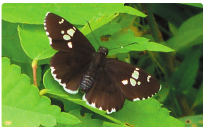
ダイミョウセセリ

シロチョウ科 開張 40 ~ 50mm 食草：シロツメクサ 黄色の翅に紋が入っている。