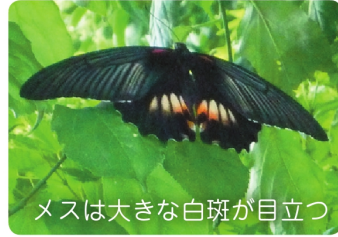
メスは大きな白斑が目立つ

アゲハチョウ科 開張 90 ~ 120mm 食草：ミカン類 尾状突起がない。温暖化により志木でも見られるようになった。