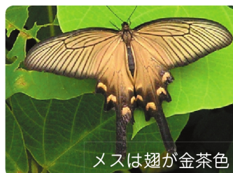
メスは翅が金茶色

アゲハチョウ科 開張 75 ~ 100mm 食草：ウマノスズクサ 尾状突起が長い。メスは翅が金茶色。