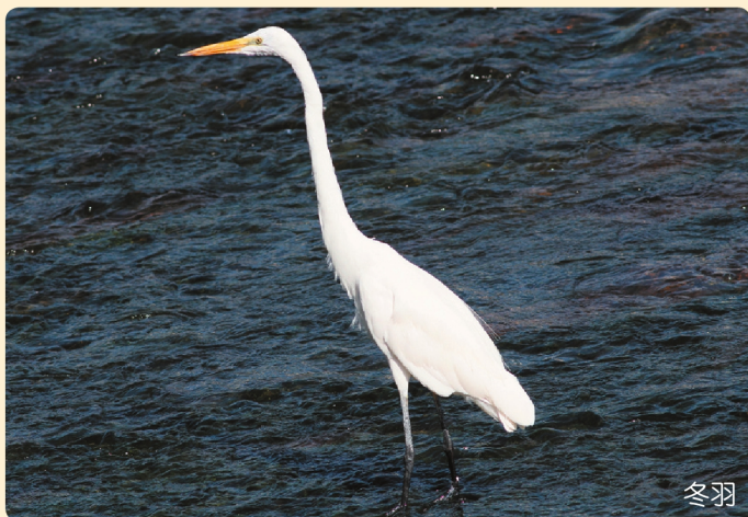
白サギの中で最大