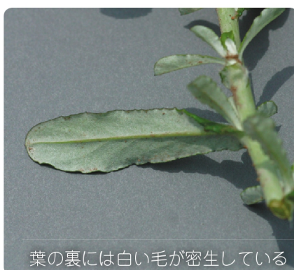
葉の裏には白い毛が密生している

キク科 花期 5～8月 外来植物 〈南アメリカ〉 高さ 20～80cm。茎や葉の裏には白毛が密生し白いが、葉の表は毛が少ない。茎につく葉の縁は波打つ。花は茎の上部に穂状に集まり、直径約4mm。道ばたや空き地などで見られる。